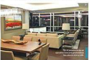
Disfruta con calma desde la máxima privacidad una gran vista al paisaje urbano.